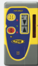
HR350 Empfänger (Hochbaupaket)